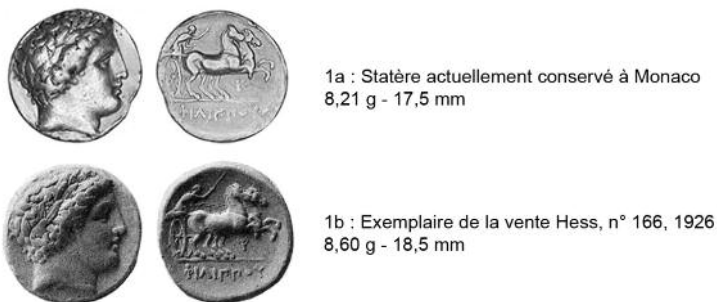
Figure 1 – Le statère de Monaco (1a) et l'exemplaire de la vente Hess (1b)

La monnaie découverte est issue de l'imposant monnayage d'or macédonien inauguré vers 345 ou 342 par Philippe II (10). Au droit figure une tête laurée d'Apollon à droite et au revers la légende grecque ΦΙΛΙΠΠΟΥ surmontée d'un bige galopant à droite ; un canthare placé sous l'avant-train des chevaux complète le type (fig. 1a). Les coins de droit et de revers sont référencés par G. le Rider, il place cette variété « au canthare » dans l'atelier de Pella vers 340-328 ou 336-328 av. J.-C. (11).