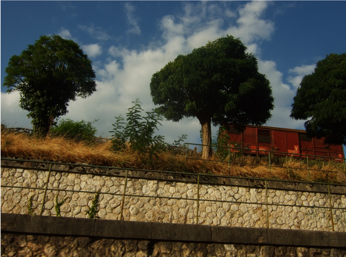
Photographie 1. Wagon stocké à proximité de la gare de Vierzon.