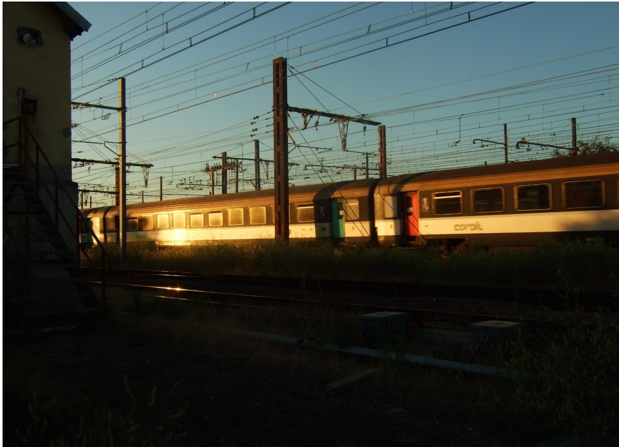
Photographie 2. Passage d'un train devant un poste d'aiguillage à Vierzon-Villages.