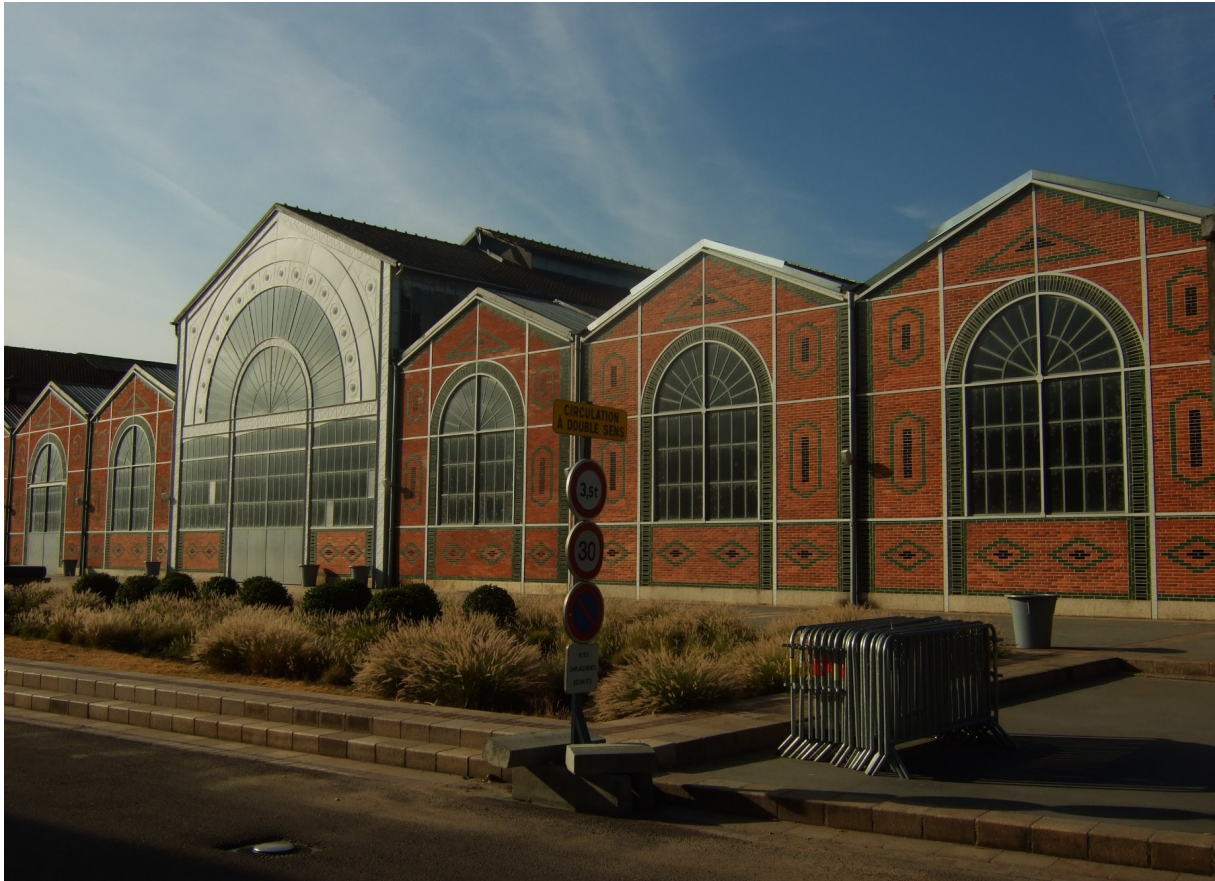
Photographie 3. Façade du bâtiment B3 de l'ex-Case.