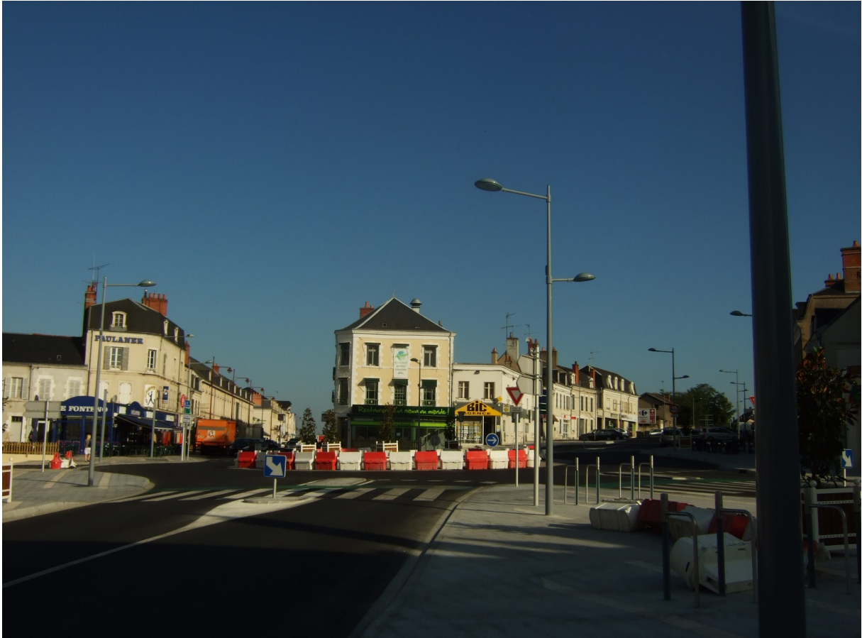
Photographie 5. Place Gabriel Péri.