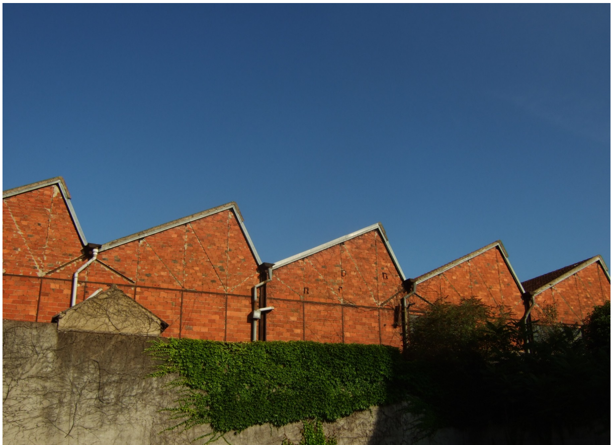
Photographie 4. Pignon d'un bâtiment (îlot B9) de l'ex-Case.