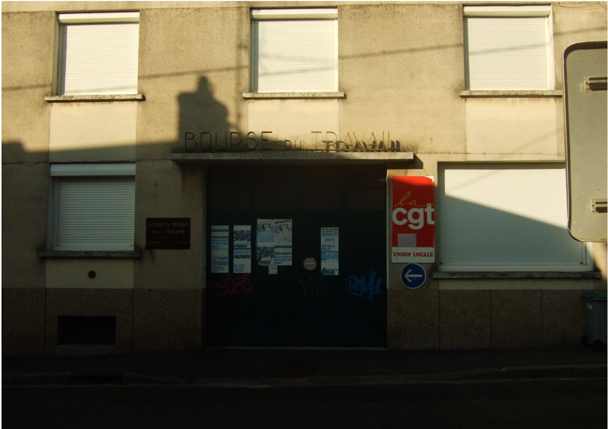
Photographie 6. Bourse du travail, rue Marcel Perrin.